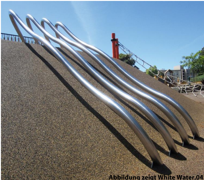
Abbildung zeigt White Water.04