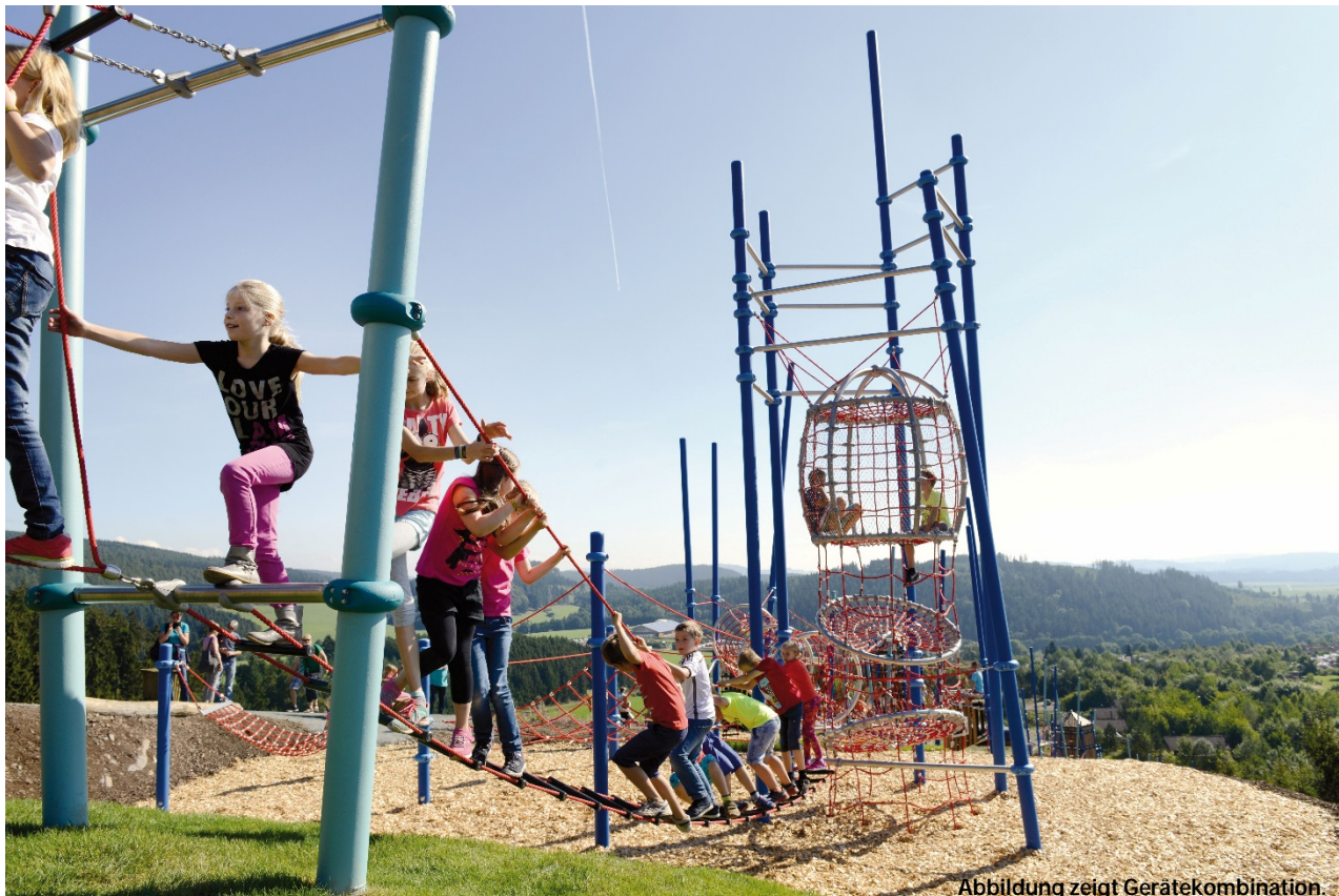
Abbildung zeigt Gerätekombination.