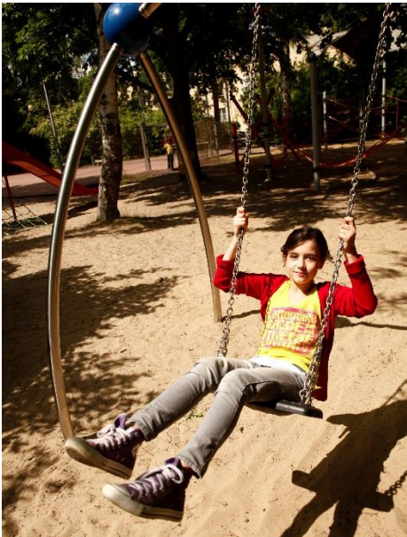
Swingo.2.3 Einsitzige Schaukel mit ansprechender Erscheinung der Urban Design Spielpunkte.