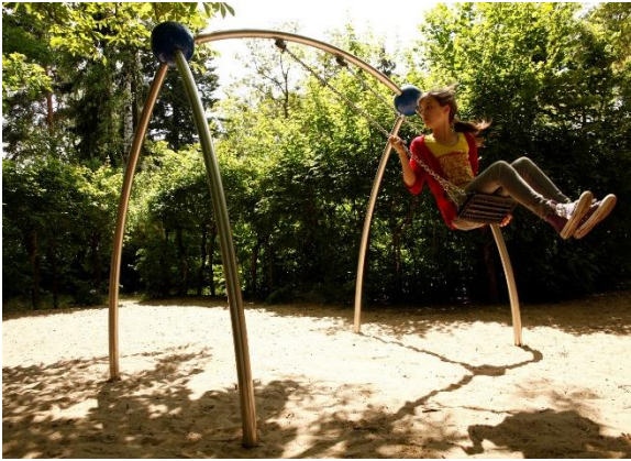
Swingo.2.1 Einsitzige Schaukel mit ansprechender Erscheinung der Urban Design Spielpunkte.