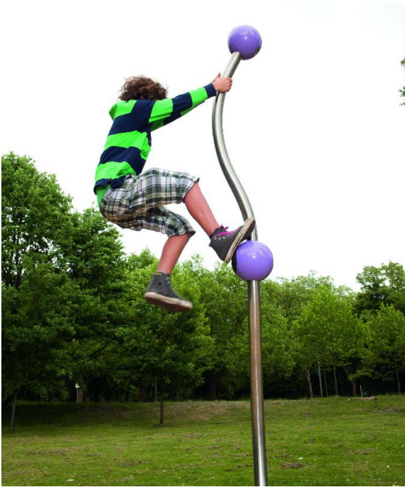
Spirelli.01 Die Nudel zum Klettern. Ein Stück beispielbare Kunst.