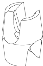
Der Kugelknoten vor der hydraulischen Verpressung

Nach Ablauf des auf die spezielle Rohform abgestellten Patents im Jahr 2001 sind auch auf dem europäischen Markt Kopien dieser Elemente aufgetaucht. Jedoch bei weitem nicht so harmonisch abgestimmt und oft auch aus nicht geeigneten Werkstoffen.