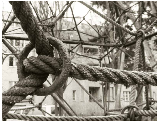
Rundring in einem Gerät von 1978, das heute noch in Betrieb ist

Anwendung des Kleeblattringes auf andere Seilmacharten und Durchmesser ausgeweitet worden. Mittlerweile nutzen wir ein patentiertes Verfahren um unsere Kleeblattringe in Raumnetze einzubringen.